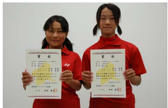
第3位 町田・杉本(高崎JTC)