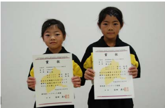
第3位 市川・市川(館林スポ少)