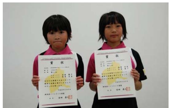
第3位 長壁・綿貫(箕郷スポ少)