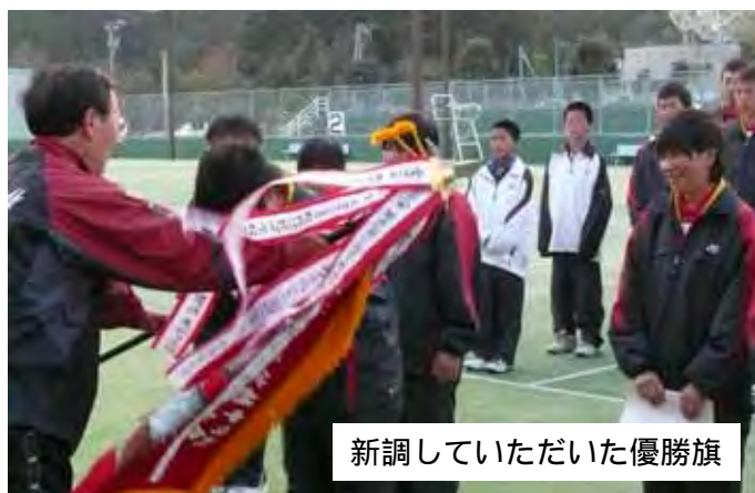
新調していただいた優勝旗