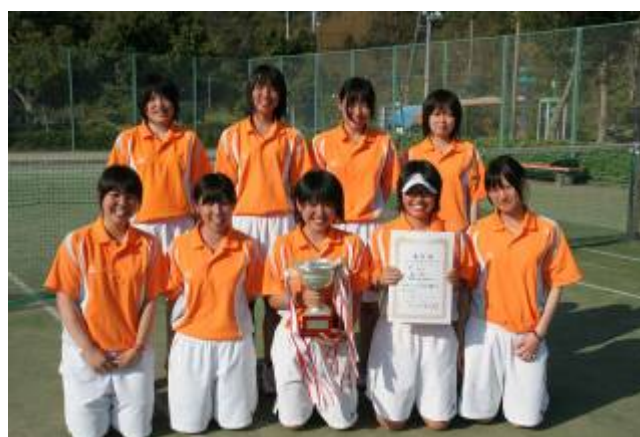
女子団体優勝(倉東)