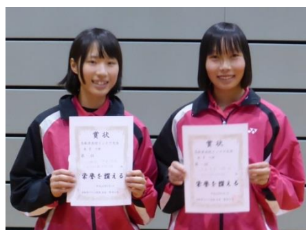
第 3 位 八幡・伊達ペア(米子松蔭)