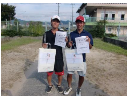
第2位 山口・升間ペア (鳥大愛球会・鳥大L.cat)