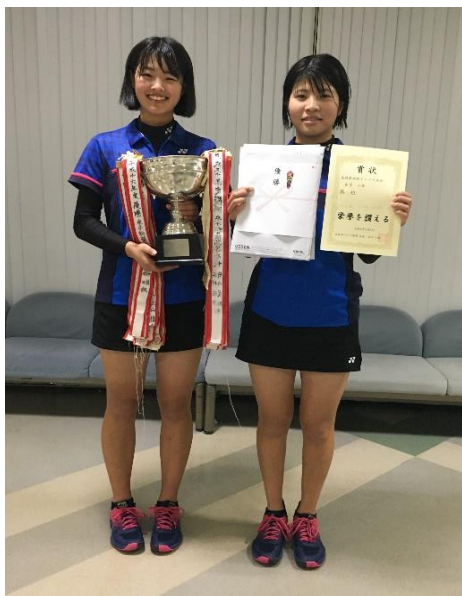
第 1 位