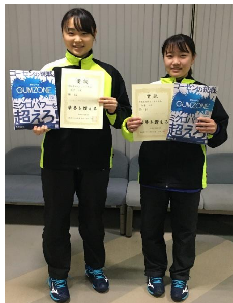
第 3 位