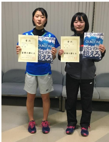
第 2 位