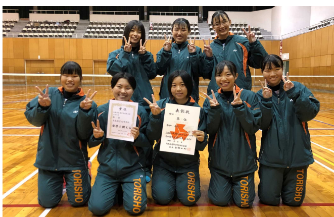
第3位 鳥取商業高校