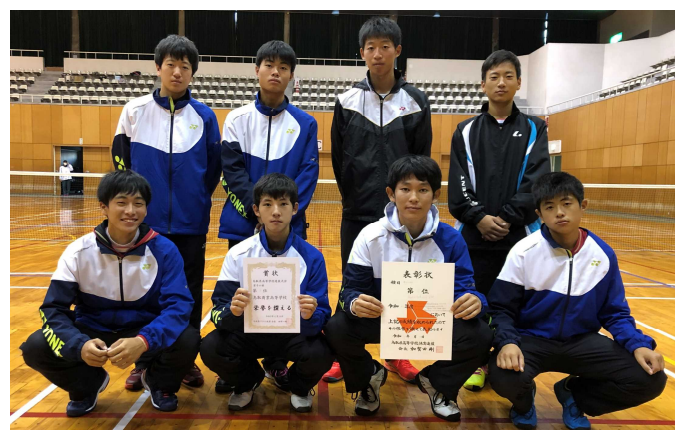
第3位 鳥取商業高校