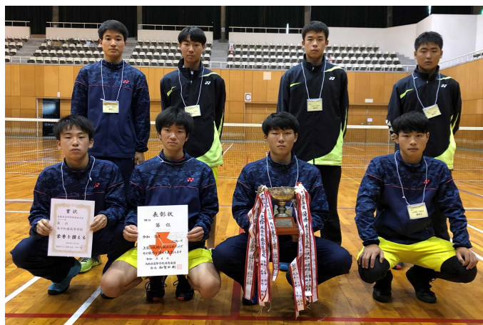
優勝 米子松蔭高校 (3年連続9度目)