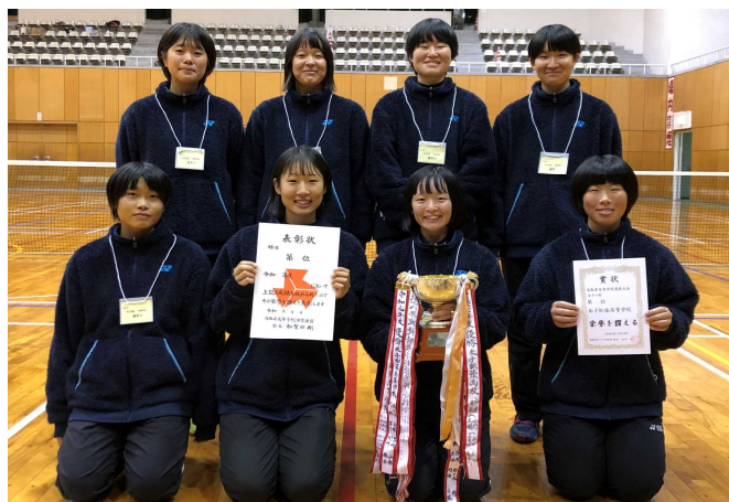
優勝 米子松蔭高校 (9年連続18度目)