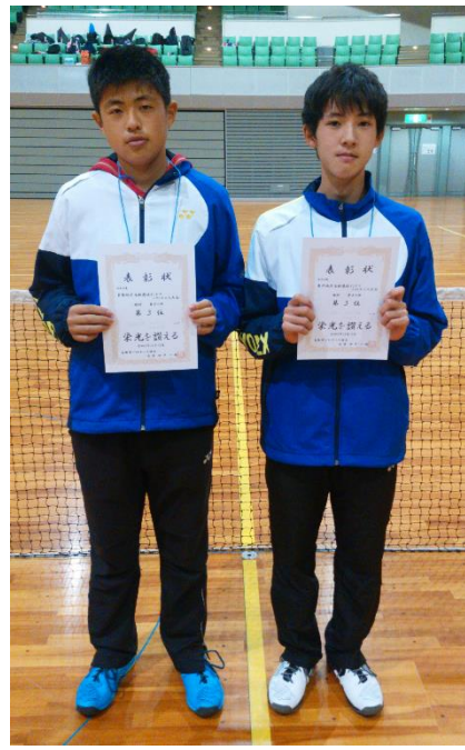
第3位 朝倉・入江ペア(鳥取商業)