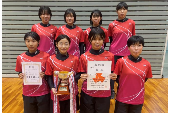
優勝 米子松蔭高校 (11年連続20度目)