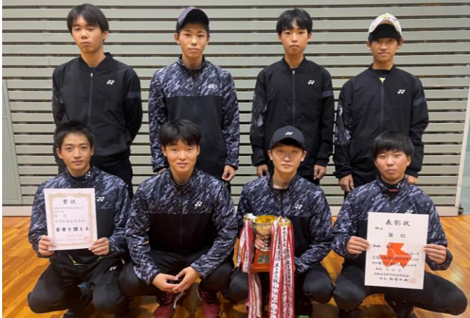
優勝 米子松蔭高校 (5年連続11度目)