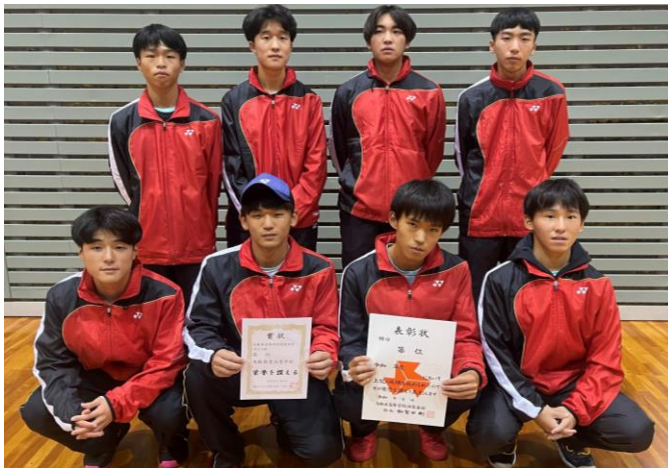
第2位 鳥取商業高校