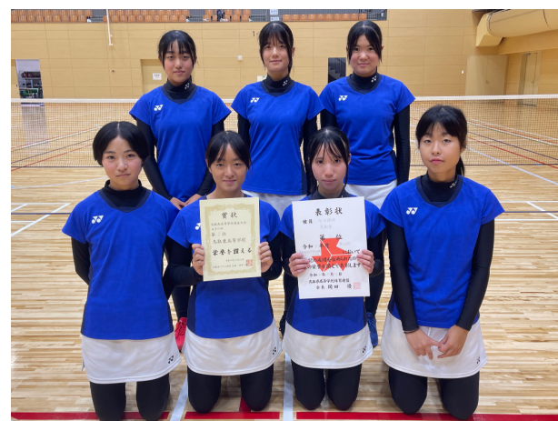
第2位 鳥取東高等学校