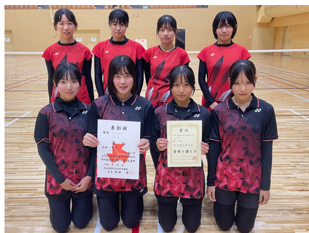
第3位 倉吉東高等学校