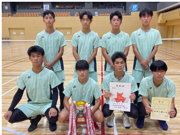
優勝 米子松蔭高等学校 (8年連続14度目)