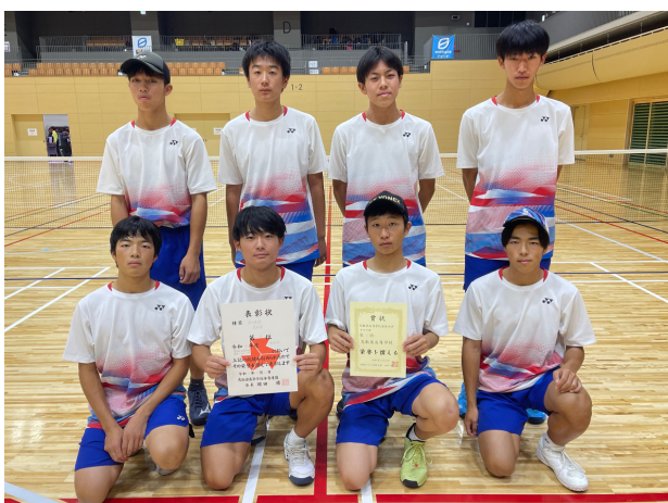
第2位 鳥取東高等学校