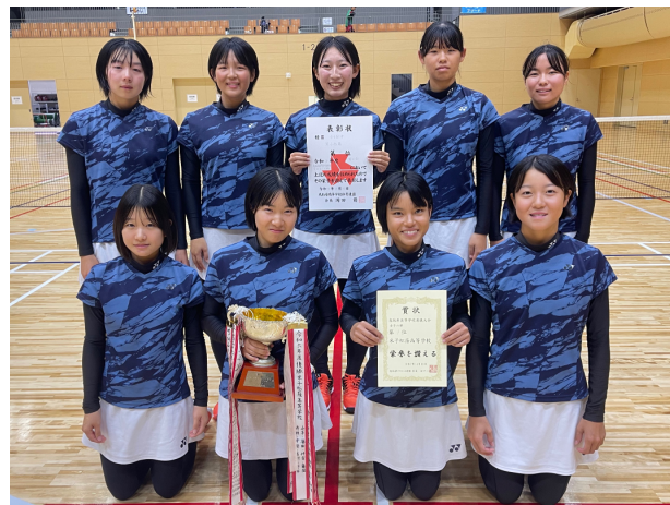
優勝 米子松蔭高等学校 (14年連続23度目)