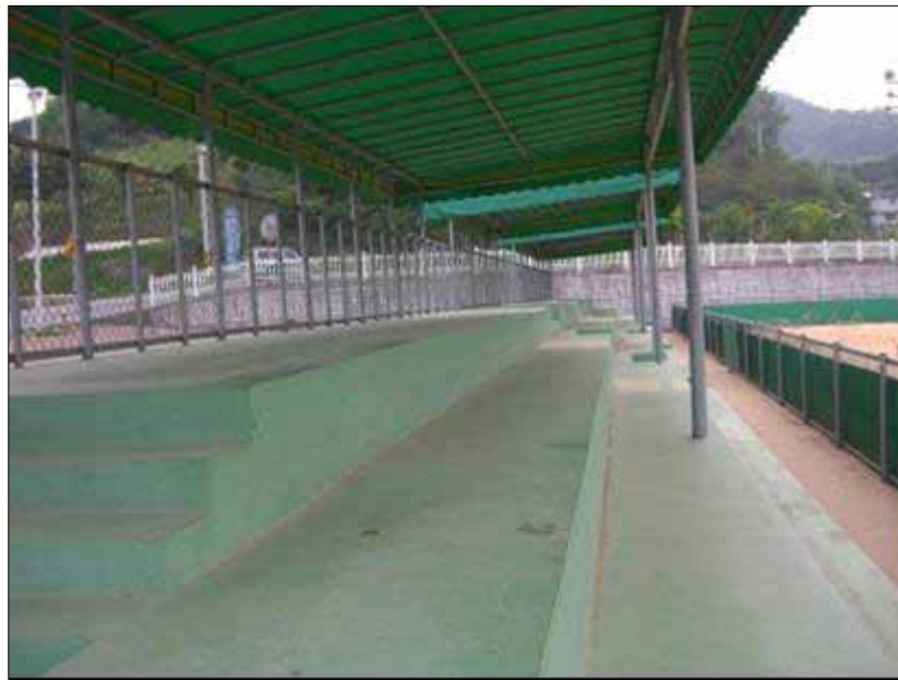
スタンド(アンツーカーコート ~ 側)