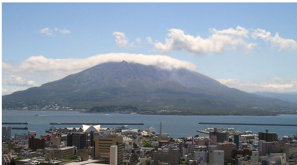
【城山展望台からの桜島】

期日：平成26年1月26日(日) 会場：薩摩川内市 総合体育館サンアリーナせんだい 主催：九州ソフトテニス連盟 主管：鹿児島県ソフトテニス連盟 後援：鹿児島県教育委員会 (公財)鹿児島県体育協会 鹿児島市教育委員会 南日本新聞社 ナガセケンコー株式会社