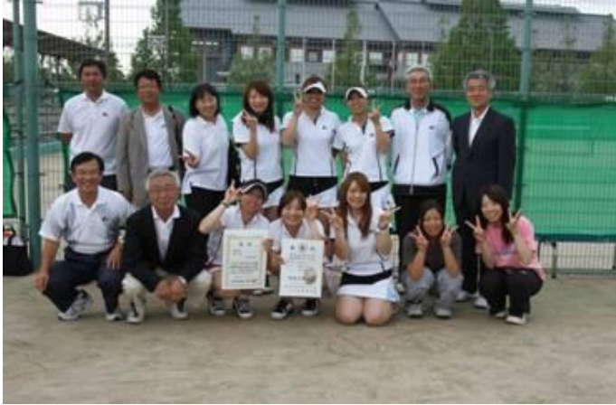
成年女子 優勝 徳島県