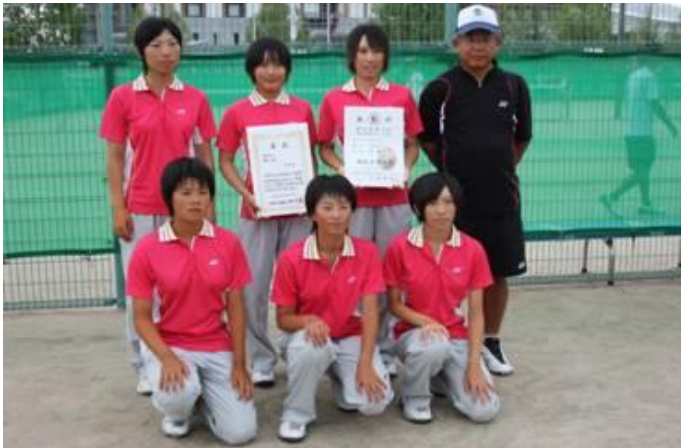
少年女子 優勝 徳島県