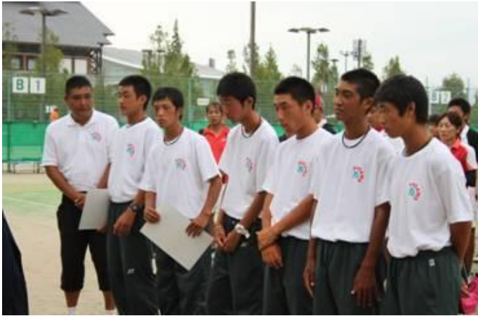
少年男子 優勝 香川県