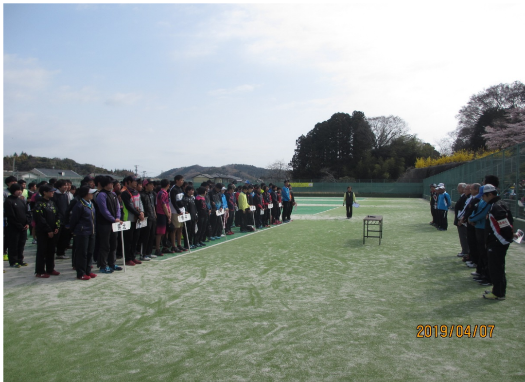
開会式（役員・選手整列）