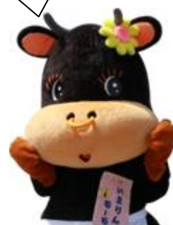
伊万里市マスコットキャラクター