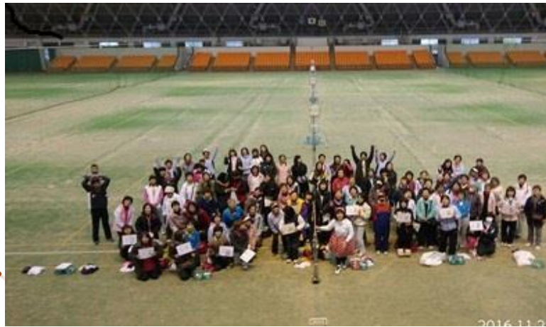
今回は、総勢91名参加して頂きました。