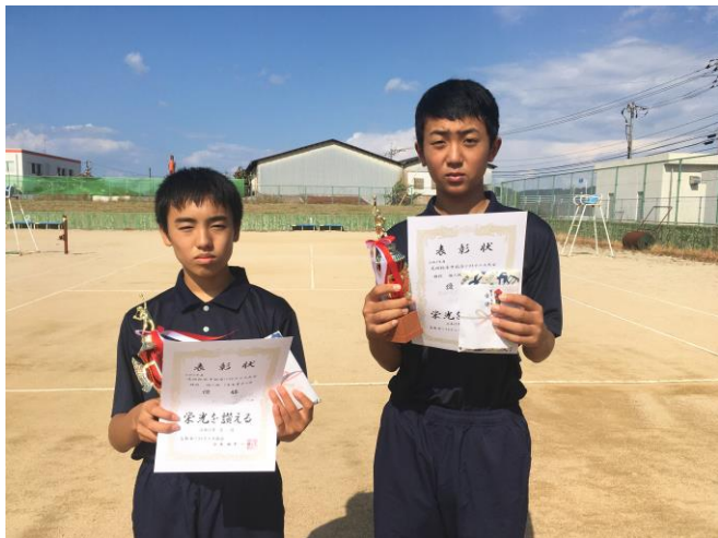
優勝 今奥・山中ペア (鳥取市立中ノ郷中学校)